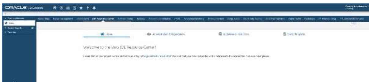
Abbildung 1; Beispiel E1 Page Home

Mit der FSS Value AddOn Solution JDE Resource Centre stellen Sie allen Anspruchsgruppen Files zum Herunterladen zur Verfügung. Eigene Mitarbeiter sowie Entwickler bzw. Berater können dort Dateien austauschen bzw. zum Download zur Verfügung stellen. Verwalten Sie ihr Know-how zentral an dem Ort wo es auch gebraucht wird.