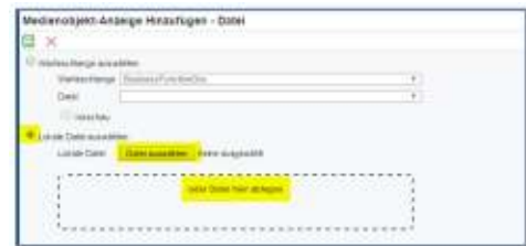
Abbildung 3; Anhängen eines Mediaobjektes zu einer Pendezenz